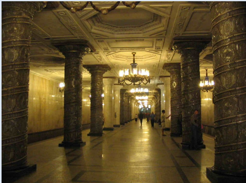
Metrostation Awtowo („Stalin's Kathedralen“)