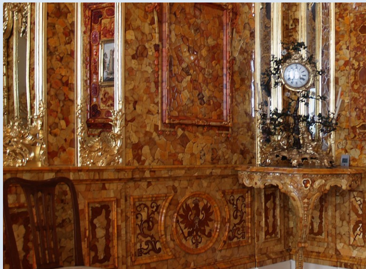
Bernsteinzimmer im Katharinenpalast

Für alle angebotenen Transfers steht Ihrer Privatgruppe ein guter Kleinbus mit einem persönlichem Chauffeur zur Verfügung. Das komplette angebotene Programm inkl. aller Transfers und Eintrittsgelder ist inklusive.