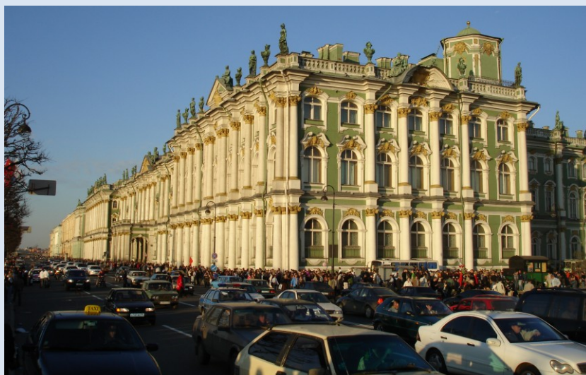
Admiralität, Isaaskathedrale und Eremitage