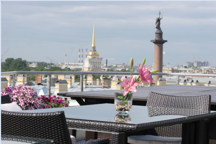
Dachterrasse des Café Bellevue Brasserie im Kempinski