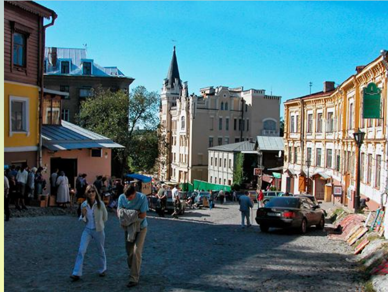
Andreashang mit dem Schloss Löwenherz