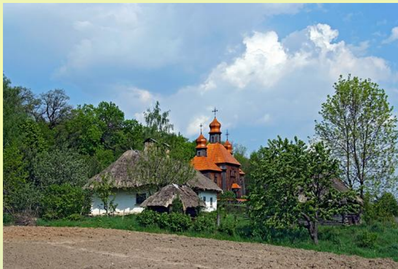
Einige wunderschöne Holzbauten in Pirogowo