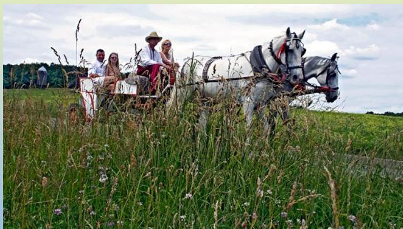
Romantische Kutschfahrt in Pirogowo