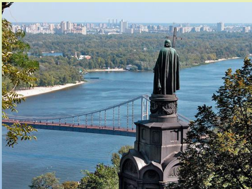
Wunderbare Aussicht vom Wladimirhügel