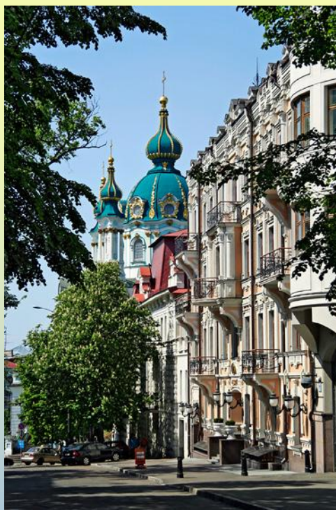
Wunderschöner Altkiewer Berg

Das Besichtigungsprogramm ist unsere Empfehlung – es ist gut durchdacht und ist ein Muss jeder Kiew Reise. Das Programm wird im Umfang wie beschrieben organisiert, kann jedoch im Ablauf der Reihenfolge individuell angepasst und optimiert werden. Alle aufgeführten Eintrittspreise, Transfers, Abendvorstellung und Mittagessen sind im Reisepreis enthalten.