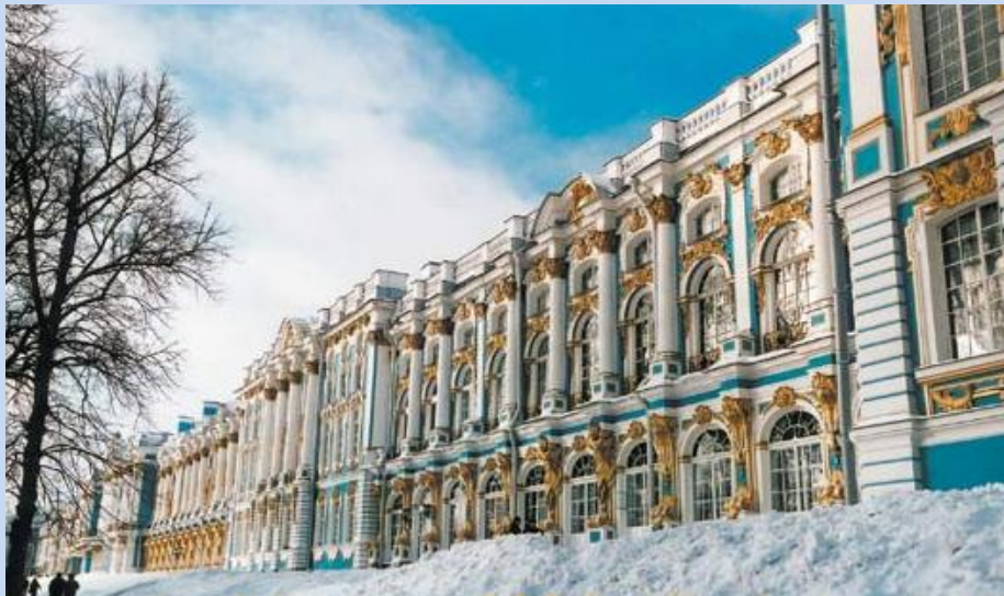
Bild: Katharinenpalast in Puschkin