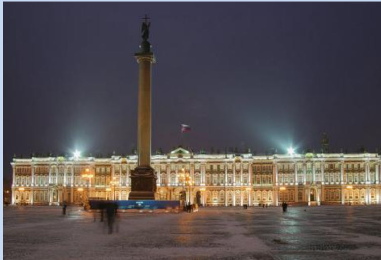
Bild: Eremitage /Schlossplatz