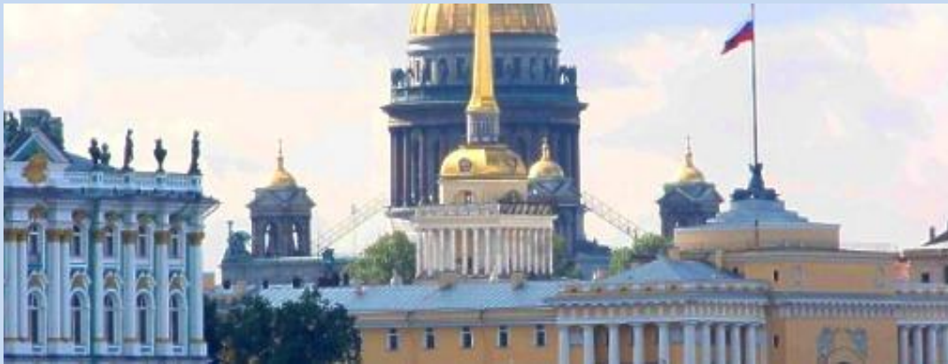
Bild: Eremitage, Admiralität und Isaakskathedrale