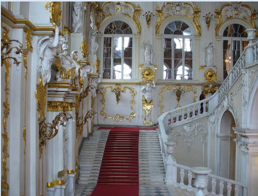
Jordantreppe in der Eremitage