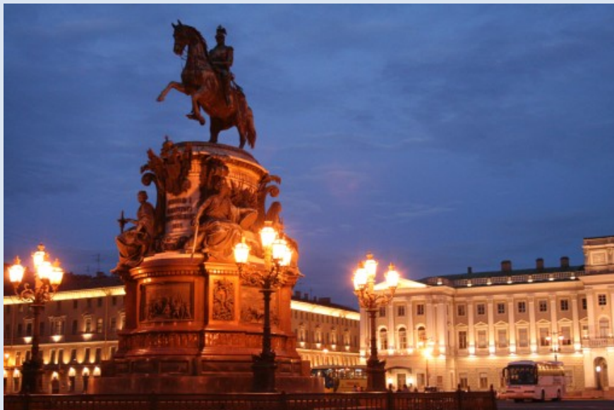
Isaaksplatz mit dem Denkmal des Zaren Nikolaus I.