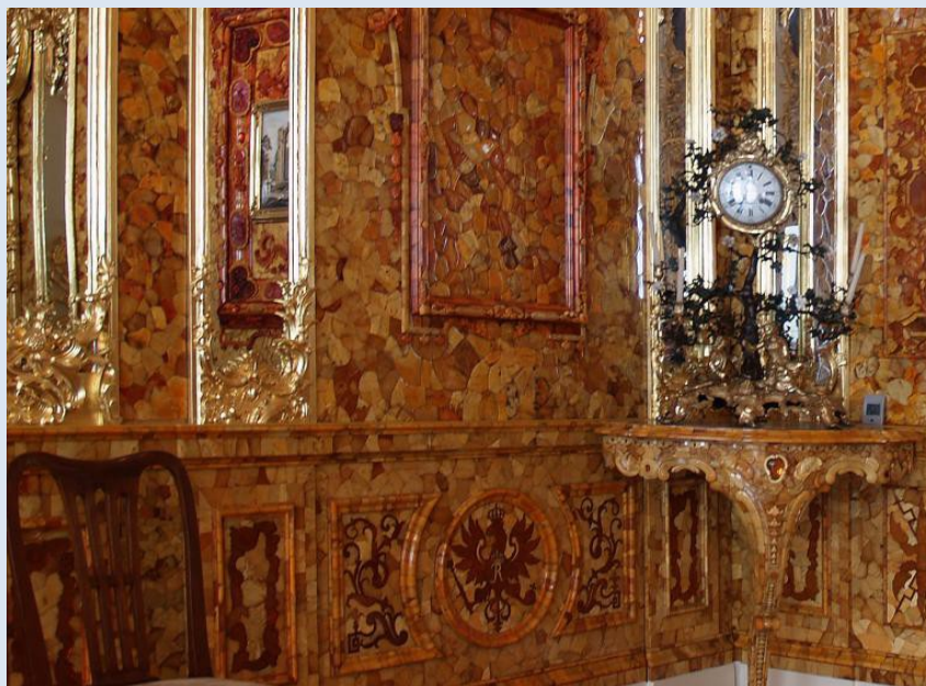
Das legendäre Bernsteinzimmer